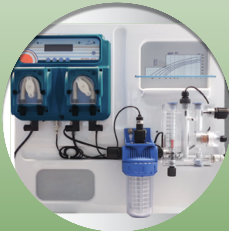
Pannello di dosaggio EASY POOL cloro libero e pH Dosing panel EASY POOL free chlore and pH